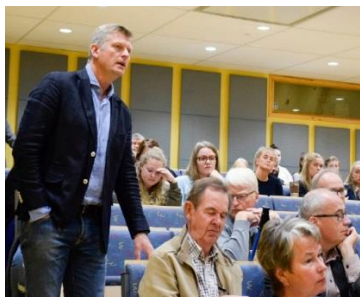
Fra valgkampmøtet på HSN