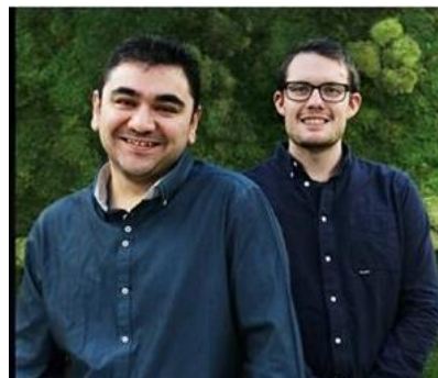
Kull 3 startet sitt program 1/9 2017