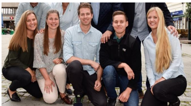
Kull 2 fullfører sitt 18 mnd. program 31. mars 2018

Traineeprogrammet opplever stor anerkjennelse og oppslutning fra bedriftene. Interessen og de meldte ønsker for å få en trainee i kull 4, er stor. (kull 4 starter 1. september 2018).