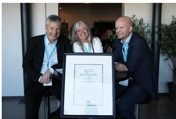
Spenncon Rail fikk RNFs næringspris for 2018.