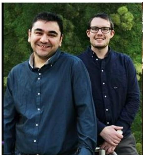
Kull 3 fullfører sitt program 30. mars 2019 og begge har fått jobb i sine respektive bedrifter.

Vi ansatte i 2018 fire gode kandidater i kull 4 og vi har to kandidater i kull 3 som er ferdige i mars 2019. Snart går vi i gang med rekrutteringen til kull 5 – og vi er veldig stolte av traineene våre og av å kunne bidra til å tiltrekke ny, viktig kompetanse til regionen.