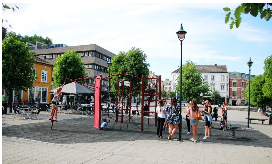
Bilde fra byvandring ifm datainnsamling til rapporten om sentrum.

Samtidig skilte vi da ut det mer utviklingsrettede arbeidet med sentrum, ved at vi dedikerte prosjektleder til å gjennomføre et forprosjekt med fokus på sentrumsutvikling. Vi gjennomførte forprosjektet 'Erigo' og samarbeidet godt med kommunen, gårdeiere og handelsnæringen i byen for å få opp mest mulig fakta om sentrum – hvor vi er i dag og hvor vi skal. RNF leverte en rapport i august 2018 som har fått stor oppmerksomhet i regionen, og som vi har presentert i flere fora. I 2019 planlegges det et stort hovedprosjekt, som oppfølging av dette forprosjektet.