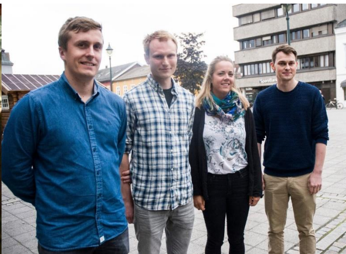
Kull 4 startet opp høsten 2019.