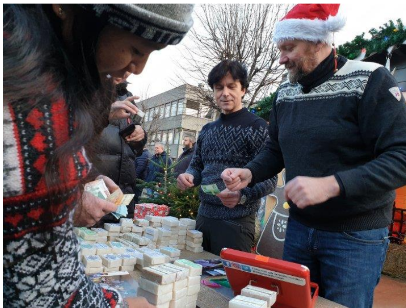
Godt samarbeid med butikkene i sentrum sikret et vellykket Handlingens Menn arrangement på torvet før jul.

Vi gjennomførte også i 2018 flere arrangementer enn tidligere, blant annet 'Vinter i Hønefoss' og opptaket av innspillingen av Handlingens menn på Søndre Torg i samarbeid med RU, i tillegg til de vanlige aktivitetene 'Midtsommer' og julegateåpningen. Med flere ressurser på plass hadde vi muligheten til å ta på oss flere slike arrangementer.